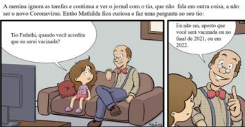
Figura 3 – Um caso de Disjunção Exclusiva.

Perguntas Desafiadoras: O que podemos concluir do conectivo? É possível criar um modelo para esses resultados como foi construído no caso anterior? Como?