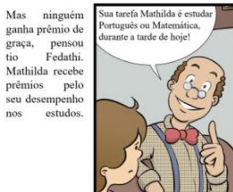
Figura 2 – Um caso de Disjunção Inclusiva

Daí encontra-se a prova: “A tabela verdade define P \wedge Q como verdadeira se, e somente se, P e Q forem verdadeiras (STANAT; MCALLISTER, 1977, p. 11, tradução nossa)”. Chama-se conjunção de duas proposições p e q a proposição representada por “P e Q”, cujo valor lógico é verdade (V) quando as proposições P e Q são ambas verdadeiras e falsidade (F) nos demais casos.