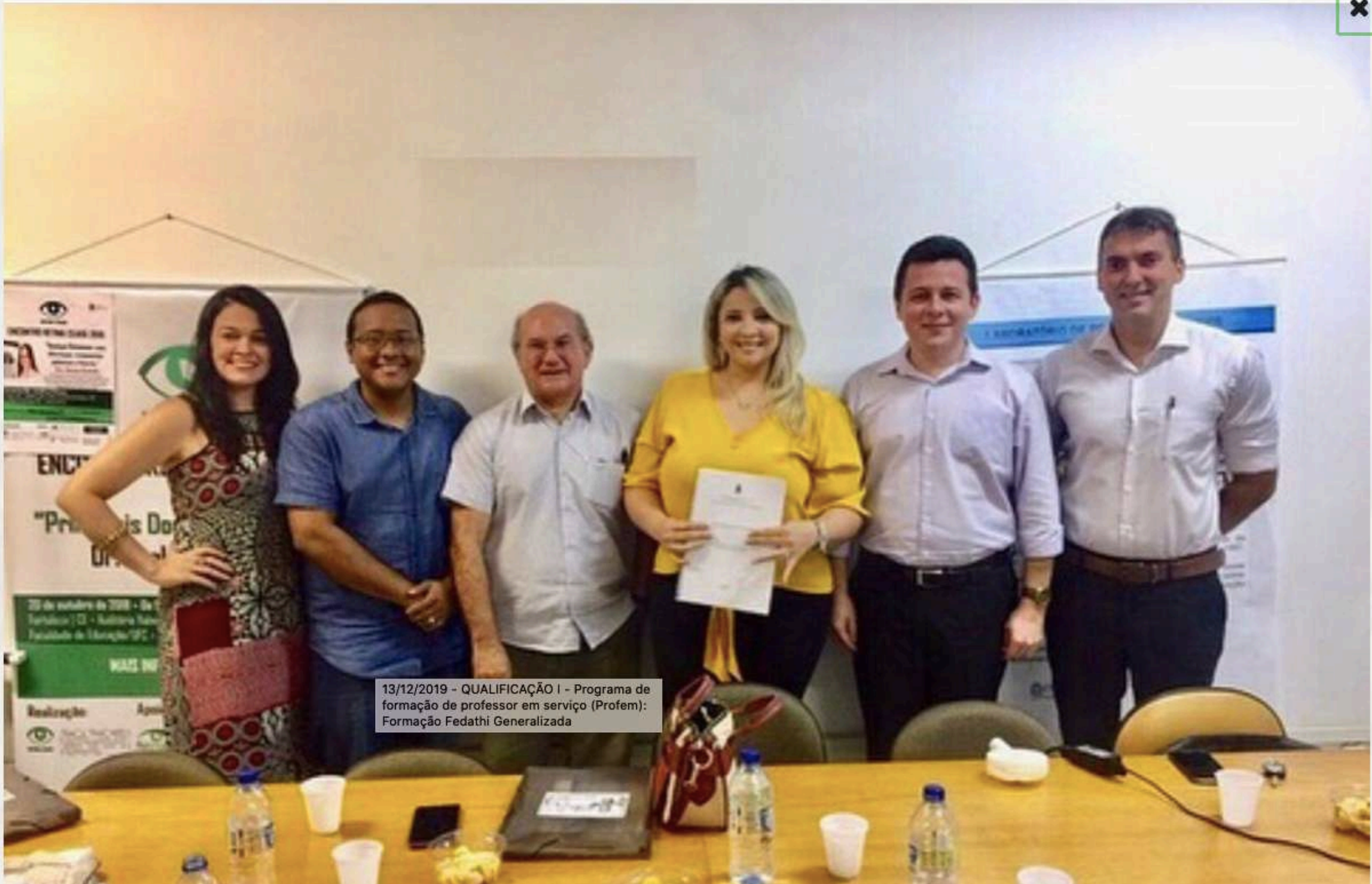
13/12/2019 - QUALIFICAÇÃO I - Programa de formação de professor em serviço (Profem): Formação Fedathí Generalizada